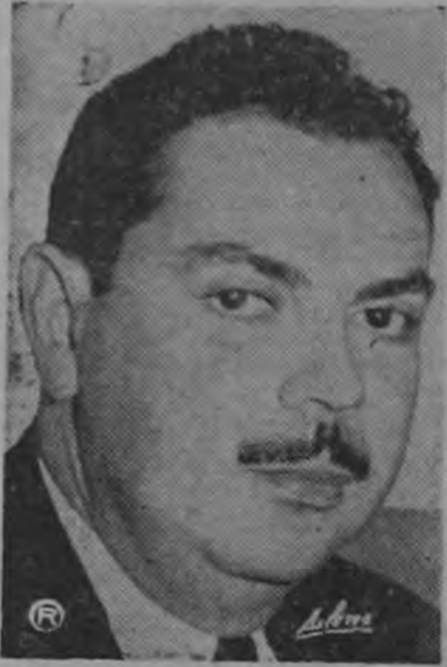
Embajador LEONTE HERDOCIA